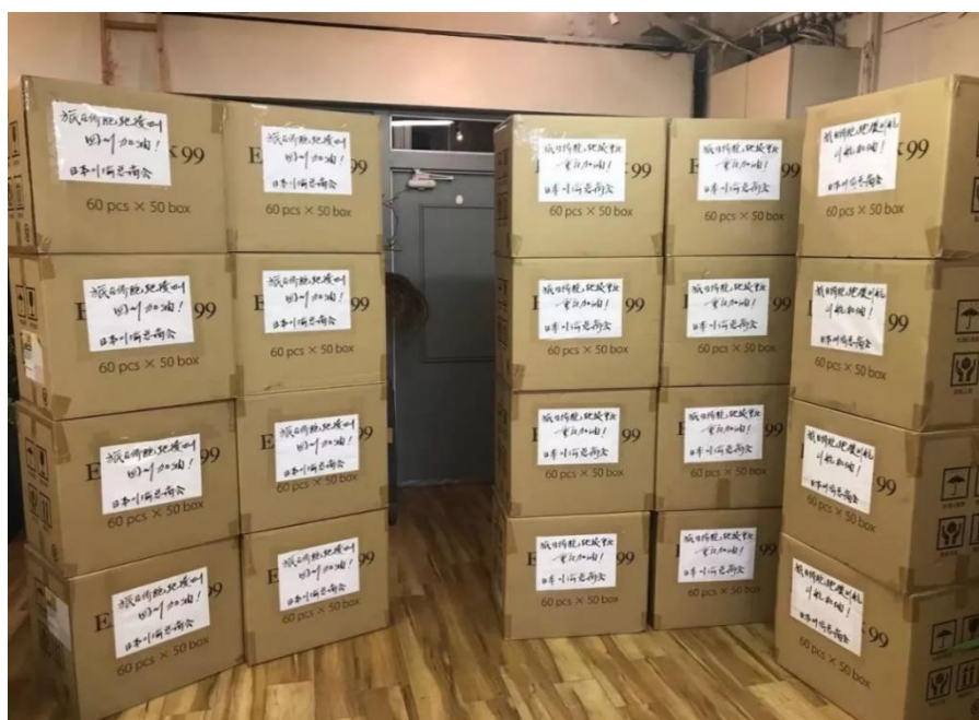
日本浙江总商会全力为家乡调配物资